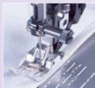
Grote keuze aan naaldposities! Voor nauwkeurig doorstikken zonder de stof te verplaatsen! Uiterst geschikt voor het inzetten van ritsen.

Nog veel meer optionele accessoires beschikbaar. Ga naar uw PFAFF® dealer of www.pfaff.com