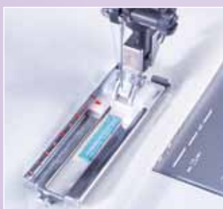
Professionele knoopsgaten zonder de stof te draaien.

de standaard naaivoet, de geleider voor doorstikken/quiltten, de transparante voet, de blindzoomvoet, de ritsvoet, de knoopsgaivoet, het tornmesje, de stopvoet, de rolzoomvoet, de siersteekvoet, en een doosje naalden. Elke accessoire heeft z'n eigen plaats.