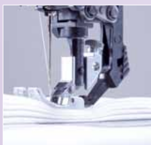
Meerdere lagen? Door de extra hoge persvoetlichter is het geen probleem om meerdere lagen stof of een dikke stof te naaien. De extra krachtige motor geeft u constante doorstikkracht.