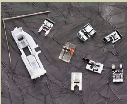
Naaivoetjes EMERALD™ 118 en 116: Naaivoet A, naaivoet B, knoopsgatenvoet C, verstelbare blindzoomvoet, ritsvoet E, glijvoet H, overlockvoet J, kant-/quiltgeleider, één-staps knoopsgatenvoet.