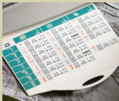
Advies nodig? Kijk op de stekengids! Uw EMERALD™ heeft een handige stekengids die u helpt met de juiste instellingen. U schuift hem heel eenvoudig onder de naaimachine vandaan.